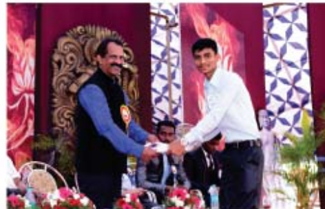
'ತೆರೆದ ಬಾಯಲ್ಲಿ ತರಗತಿ'