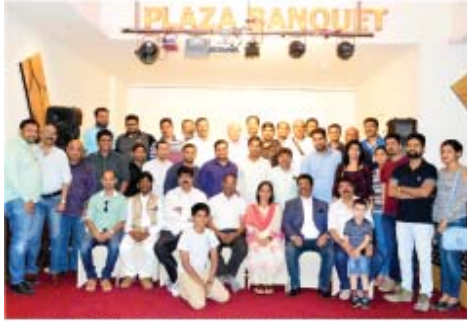
ಮೆಚ್ಚಿಯಲ್ಲಿ ಹಳೆ ವಿದ್ಯಾರ್ಥಿ ಸಮ್ಮಿಲನ ಮಾಧ್ಯಮ ಸಂಘ ಉದ್ಘಾಟನೆ