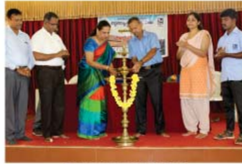
'ಶೈಲಾ' ನಾಯಕತ್ವ ತರಬೇತಿ ತಿಬ್ಬರದ ಉದ್ಘಾಟನೆ ಹಿಲ್ಸ್‌ಸೈಡ್ ರೋಟರಿ ಕ್ಲಬ್