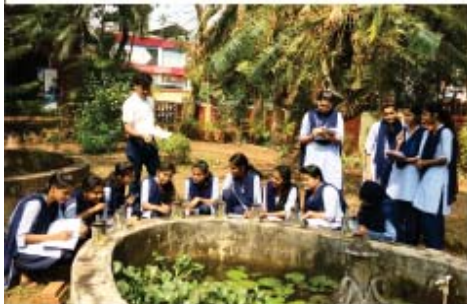
'ತೆರೆದ ಬಾಯಲ್ಲಿ ತರಗತಿ'