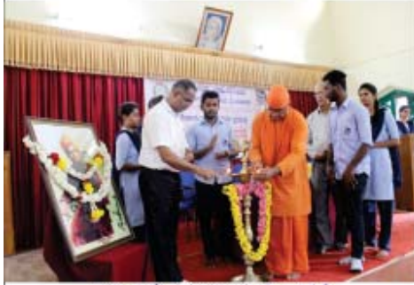
ಸ್ವಾಮಿ ವಿವೇಕಾನಂದ ಜಯಂತಿ ಆಚರಣೆ