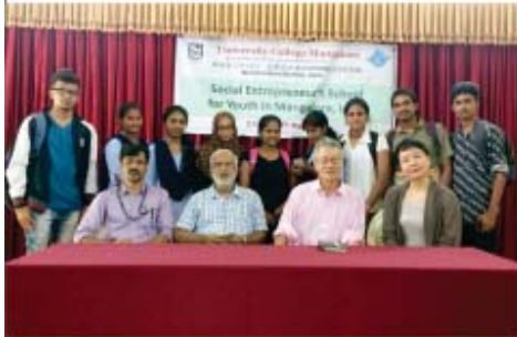
ಸಾಮಾಜಿಕ ಉದ್ಯಮ ಹೀಲತ್ ಕುರಿತು ಪರವೇಷಿತಿ ಕಾರ್ಯಕ್ರಮದಲ್ಲಿ ವಿದ್ಯಾರ್ಥಿಗಳು