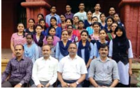
ಸ್ವರ್ಧಾತ್ಮಕ ಪರೀಕ್ಷೆಯ ತರಬೇತಿಯಲ್ಲಿ ತಿಬರಾರ್ಥಿಗಳೊಂದಿಗೆ