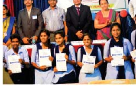
'ಶೈಲಾ' ನಾಯಕತ್ವ ಪರವೇಷಿತಿ ವಿಜೇತರು ಉದ್ಘಾಟನೆ ಹಿಲ್ಸ್‌ನಲ್ಲಿ ರೋಟರಿ ಕ್ಲಬ್