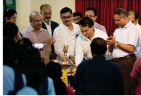
'ಶೈಲಾ' ನಾಯಕತ್ವ ಪರವೇಷಿತಿ ವಿಜೇತರು ಉದ್ಘಾಟನೆ ಹಿಲ್ಸ್‌ನಲ್ಲಿ ರೋಟರಿ ಕ್ಲಬ್