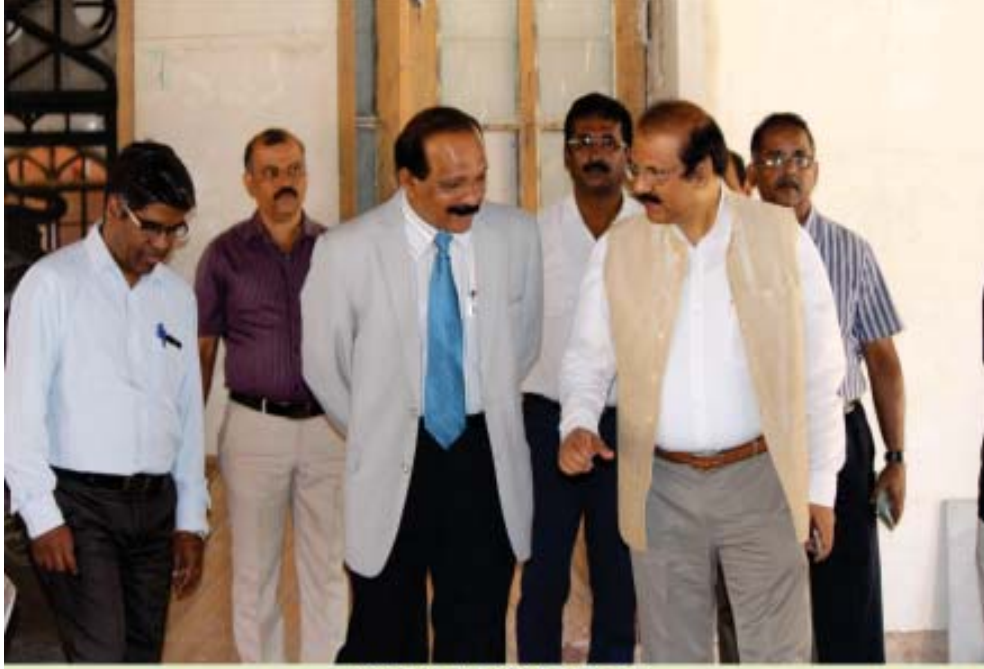
ಕುಲಪತಿಯವರು ಭೇಟಿ ನೀಡಿದಾಗ