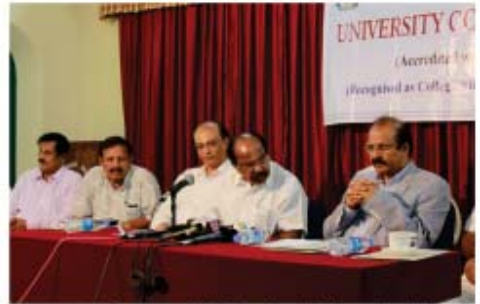
150ನೇ ವರ್ಷಾಚರಣೆಯ ಬಗ್ಗೆ ಸಮಾರೋಹವು ಸಭೆ